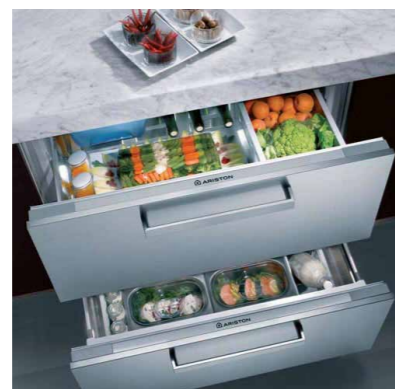
domestico household appliances